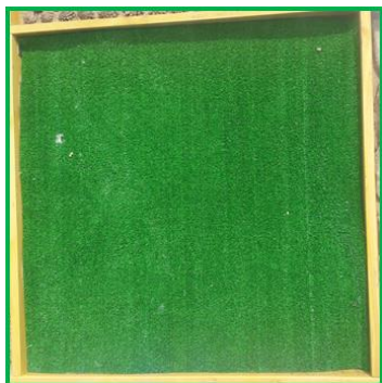
Мягкая искусственная трава